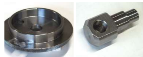
精密機械の加工例

高知県は“きらりと光る技術”を持ったユニークな企業が多く存在します。部品加工の分野においても、幅広いニーズに対応できる確かな技術を有する企業もまた数多く存在しています。 tomakichiは、県内外企業との強固なネットワークで、あらゆる加工のご要望に柔軟かつスピーディに対応いたします。小ロットでもお気軽にご相談ください。